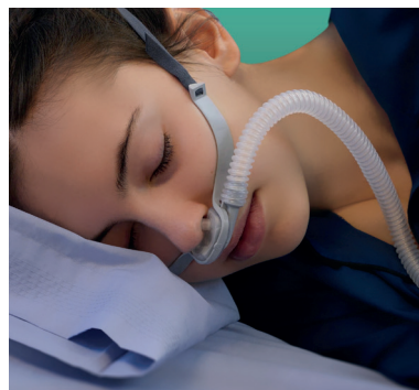
Sauerstoff- und Aerosoltherapie