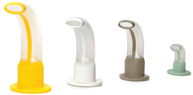
ISO Größe 9.0 ISO Größe 7.0 ISO Größe 6.5 ISO Größe 3.5

Jede Einrichtung muss individuell entscheiden, wie diese Änderung umgesetzt werden soll, falls vorhandene Bestände zunächst aufgebraucht werden müssen.